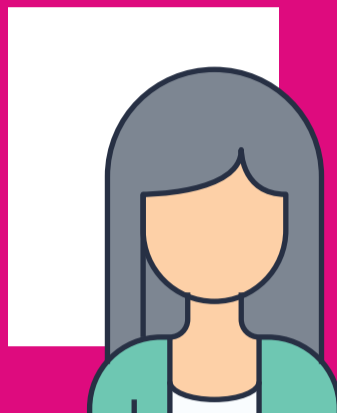
Fotografía viva de la o el ciudadano