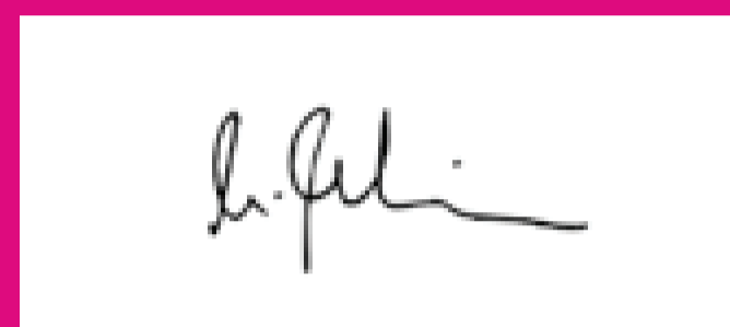
Manifestación de la voluntad de afiliación, ratificación o refrendo, a través de la firma digitalizada