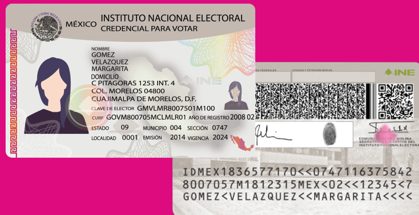
Anverso y reverso de la Credencial para Votar

Con la app se generará un expediente electrónico con: